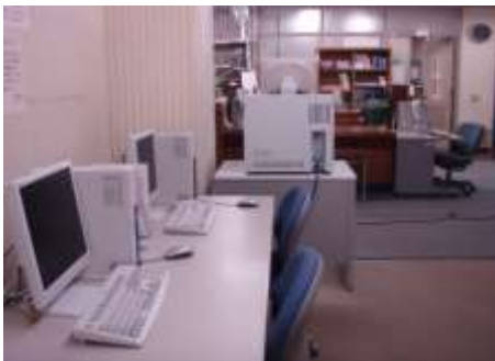
1階のカウンター前と横

OPAC 端末機は1階・2階のフロアに4台設置してあります。いつでも自由に利用が出来ます。